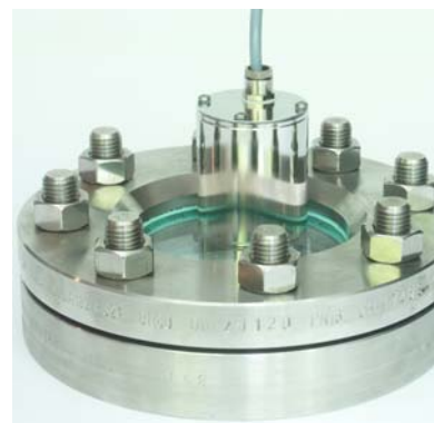
Edelstahlleuchte Typ 1600 mit PG-Verschraubung ohne Schalter kombiniert mit Schauglas DIN28120 Stainless steel luminaire type 1600 with cable gland and without switch combined with a sightglass DIN28120