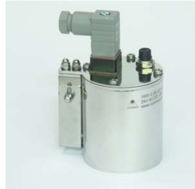
Edelstahlleuchte Typ 1600 mit Stecker und Schalter kombiniert mit Schauglas DIN11851 Stainless steel luminaire type 1600 with connector and switch combined with a sightglass DIN11851

Easy installation and maintenance due to plug and socket connection DIN-NEN175301-803 connector. Also available as option model with cable gland.