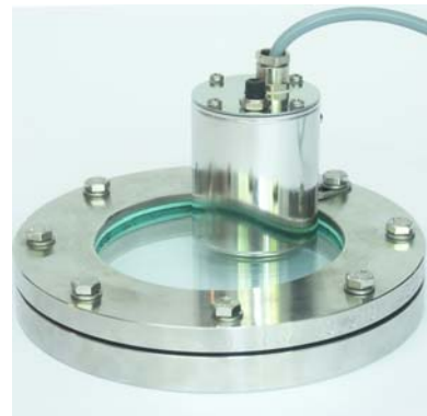
Edelstahlleuchte Typ 1600 mit PG-Verschraubung und Schalter kombiniert mit Schauglas DIN28120 drucklos Stainless steel luminaire type 1600 with cable gland and switch combined with a sightglass DIN28120 pressureless